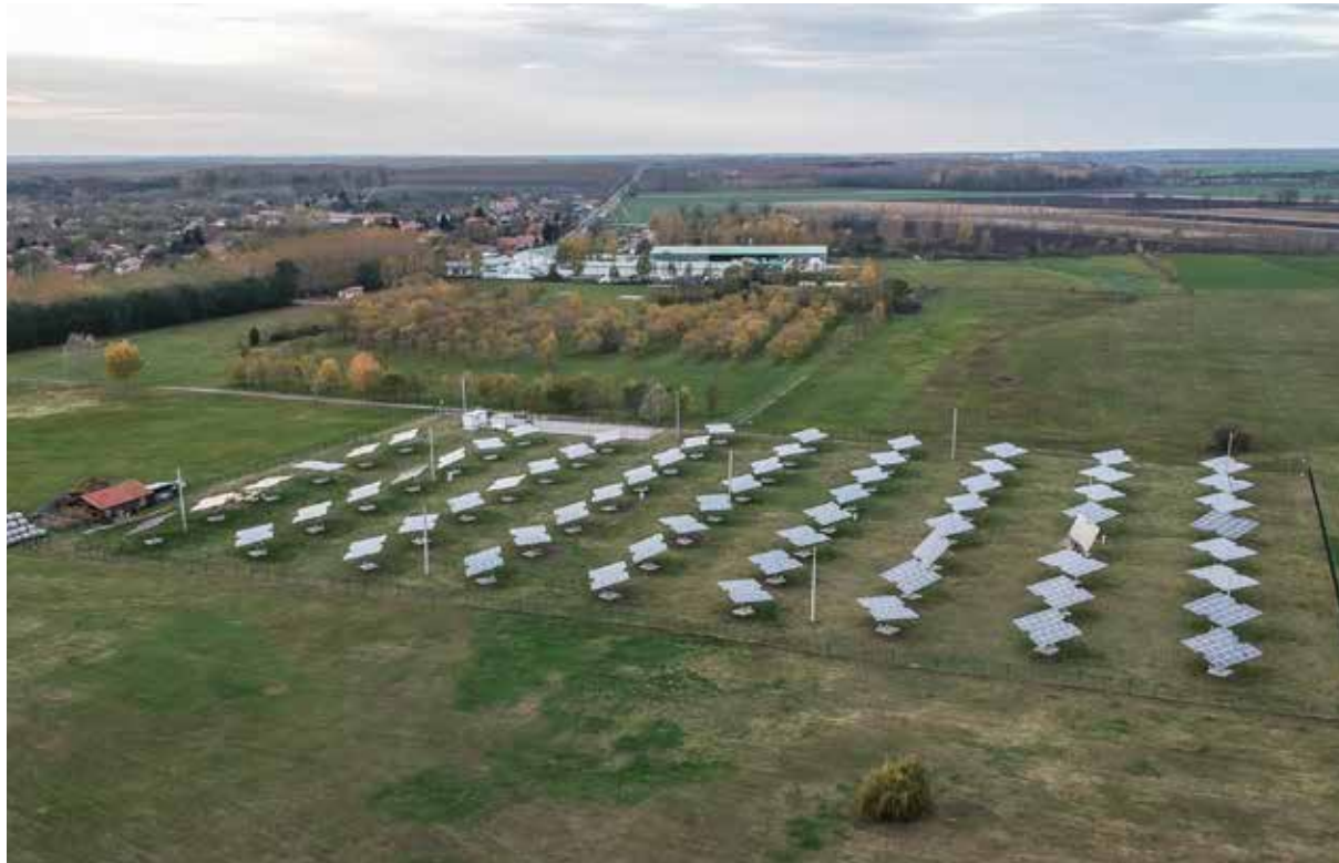
Az előrejelzések szerint 2025-re a napenergia jelenti majd a Föld fő energiaforrását

Közéleti havilap | www.pestmegyelapja.hu