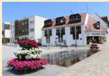
Érd vonzó, családias kertváros

hogy 2020-ig megközelítheti a százmilliárdot is. Jelentős összegeket költöttünk az oktatási intézmények korszerűsítésére, új középiskolák építését tervezzük, egy kivételével valamennyi orvosi rendelőt felújítottuk, épül az új, modern rendőrkapitányság, és lesz bíróság, ügyészség is Érden. Ezeket túlmenően is vannak beadott pályázataink, például a városi és a közúti köz-