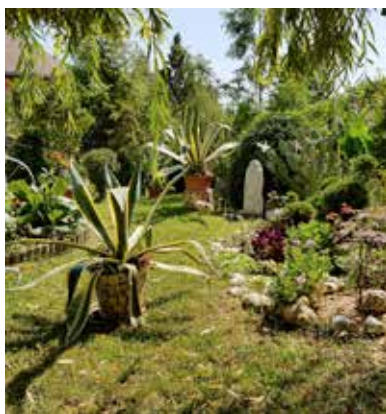
Négy magánszemély és két intézmény nyert idén „Szép Kert Tiszta Környezet” díjat - pályázat útján

Egyik nagy pályázati forrásból finanszírozott beruházásunk is lassan a végéhez ér, az épületenergetikai pályázat november végén zárul le. Az összes eddig még nem szigetelt önkormányzati épület megújul, az épületek környezetét jövőre saját forrásból tudjuk megszépíteni. A képviselő-testület elnöként szándéka volt a település szépítése, ezért az elmúlt években alapított egy „Szép Kert Tiszta Környezet” díjat, amelyet pályázat útján lehet elnyerni. Ebben az évben az összes lakosunk kapott virágmagokat, ezzel is ösztönözve lakókörnyezetük szép kialakítását. Idén négy magánszemély és két intézményünk nyerte el a díjat, gyönyörű kertek