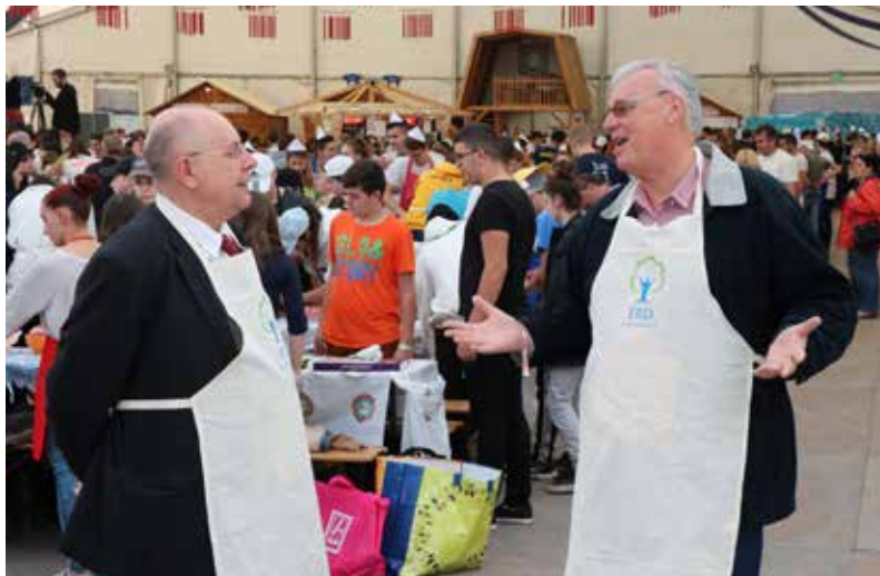
Érd polgármestere és a térség országgyűlési képviselője a kolbászfesztiválon

– A legnagyobb fegyvertény számunkra, hogy sikerült a kormányt és a törvényhozást meggyőznünk arról, hogy Érd is kerüljön be a Modern Városok Programba. A Közép-magyarországi Régió – Budapest kiemelt gazdasági fejlettsége miatt – kimaradt volna a fejlesztésekből, hiszen uniós forrásokra alig jogosult. A sikerben szerepet ját-