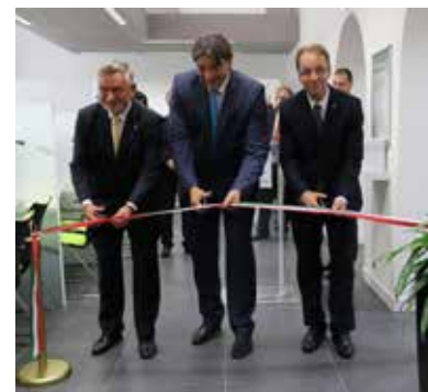
Földi László országgyűlési képviselő, Takáts László polgármester, valamint Tarnai Richárd, Pest megye kormány megbízottja

az új kormányablak a Városháza épületének legjobb minőségű épületrésze lett. Tarnai Richárd kormány megbízott beszédében rámutatott, jól végzik a járások a feladatukat, eredményes volt a járási rendszer létrehozása. Az új, egységes arculatú kormányablakot a régi okmányiroda helyén alakították ki, ahol a járási hivatal ügyintézői több mint 1500 ügytípusban tudnak segítséget nyújtani az állampolgárok számára a hagyományos okmányirodai ügyintézkéssel. A beruházás során megújult az ügyféltér és az összes háttériroda, illetve kiszolgáló helyiség. Az összesen 426 négyzetméter teljes