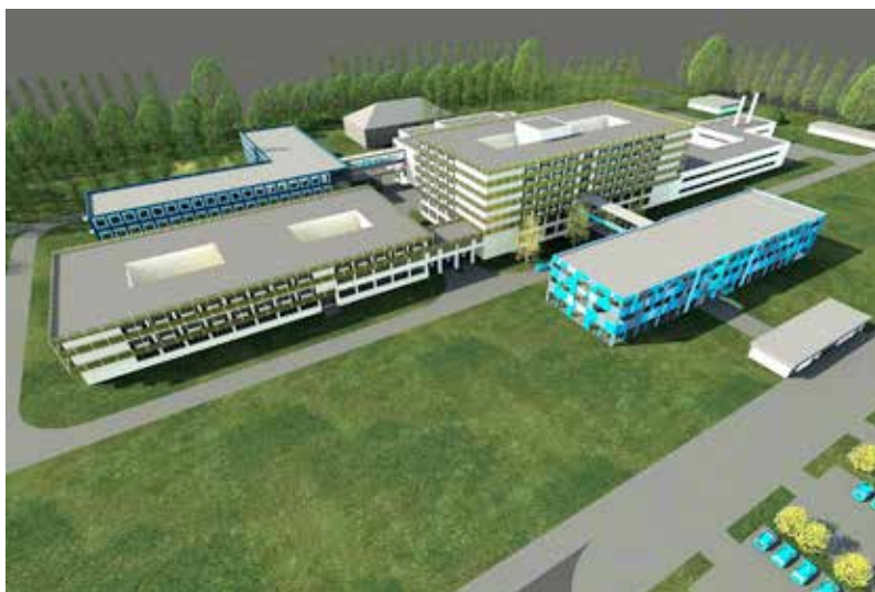
Létrehozzák a járóbeteg-ellátást végző rendelőintézetet és a belgyógyászat épületét

Hosszú út vezetett eddig az örömteli pillanathoz – emeli ki a képviselő. – Szerintem emlékeznek a kedves olvasók, hogy a baloldali kormányzása alatt 600 milliárd forintot vont ki az egészségügyből, aminek köszönhetően a fővárosi betegellátás és a kórházak teljesen leépültek, eladósodtak, a beszerzések elmaradtak, az orvosi eszközök leamortizálódtak, az egészségügyi dolgozók pedig elmenekültek a pályáról és sajnos sokan az országból is – sorolta a képviselő a nehézségeket, amelyeket le kellett küzdeni ennek a nagy volumenű egészségügyi fejlesztéscsomagnak a bejelentéséig. A Fidesz-kormány 2010-től kezdődően folyamatosan pótolja vissza az egészségügyből kivont forrásokat, és a rendszerváltás óta a legnagyobb összeget, 500 milliárd forintot fordított országsszerte az egészségügyi ellátás fejlesztésére. Összesen 77 kórházat, 54 rendelőintézetet és 97 mentőállomást újítottak fel. Országsszerte 23 új rendelőintézetet és 30 új mentőállomás épült. A vidéki kórházak és szakrendelők fejlesztését követően minden idők legnagyobb egészségügyi fejlesztése indul meg Budapesten és környékén, ez az Egészséges Budapest Program.