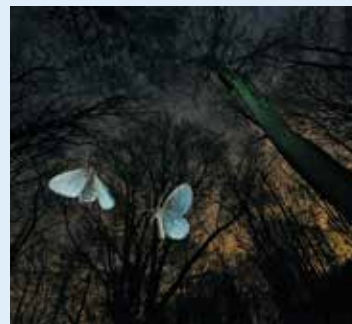
Fagyos szárnyak – A kis téliaraszoló lepke nászrepülése a Börzsönyben