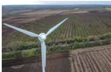
Nálunk csupán 37 szélerőmű működik

Nem vész kárba a mezőgazdasági, erdei „hulladék” sem, biomasszává alakítva, megfelelő kazánokban elégetve