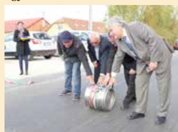
Az útátadás derűs pillanata, jobbra Szabó István megyei elnök

Aszód déli iparterületén alig másfél hónap alatt készült el a mintegy 1200 méter hosszú, aszfaltszönyeggel borított úthálózat. A projekt megvalósítása kormányzati és európai uniós támogatásból (132 millió Ft), illetve 20 millió forintos önerőből készült el. Az átadóünnepségen Sztán István polgármester mellett megjelent Szabó István, a Pest Megyei Közgyűlés elnöke, valamint Vécsey László országgyűlési képviselő is. Az aszódi ipari parkban befejeződött útépitési projekt máris újabb érdeklődőket hozott: két cég is jelezte, hogy területet kívánnak vásárolni, és ezer, illetve háromezer négyzetméteres üzemsarnokot építenek. A városvezetés bízik abban, hogy az ipari park fejlesztése tovább folytatódhat: a képviselő-testület nemrégiben döntött a csapadékvíz-elvezetés megoldásáról, melynek megvalósítása mintegy százmillió forintba kerülne. ❖