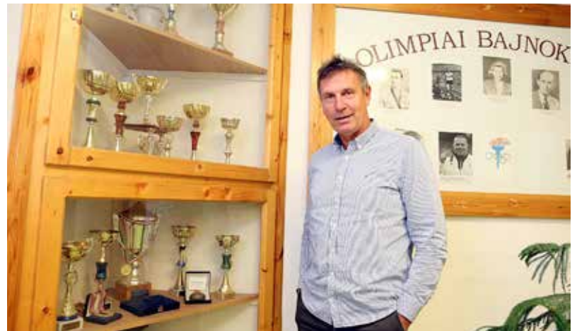
Jelenleg a Testnevelési Egyetem atlétikai tanszékének vezetője, a Magyar Atlétikai Szövetség alelnöke

Dicsőséglistája ugyancsak hosszú és tiszteletet parancsoló. A két fedett pályás Európa-bajnoki cím mellett még négy