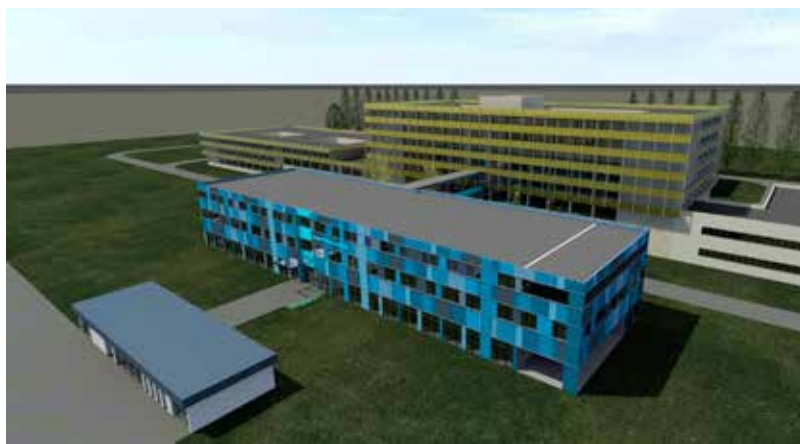
A kistarcsai kórház 17,7 milliárd forintból újul meg

– A fejlesztések mellett ugyanilyen fontos, hogy az egészségügyi munkaerőhiányt is orvosoljuk. A betegellátás javítása érdekében fontos az is, hogy több és jobban megbeccsült egészségügyi dolgozó legyen a vidéki térségekben is. ❖